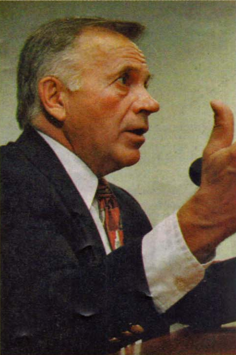
科羅拉多州國會議員譚可度表示非法移民涌入使合法移民申請停滯並不公平。

雖然朱小蓀曾說，自己首要的是做警員，華裔身分屬次要，但作為本國首位華裔警察局長，不少華裔都對他有期望。他承認，有些華裔對他寄望甚殷，並舉例，某天與一對華裔商人父子在華埠逛街時，商人告訴他華埠面對的種種問題，但兒子反而告訴父親，朱小蓀不能解決這些問題，並引述兒子說，自己不能解決風水和露宿者等問題。